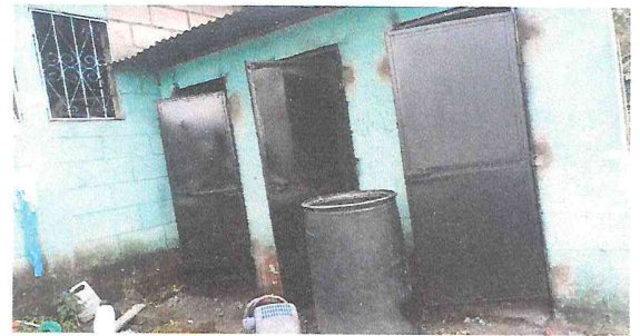
Foto 4: Depósito de agua muy pequeño, ya que el agua potable al establecimiento llega cada 8 días.