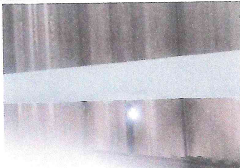
Foto 1: Techo deteriorado con perforaciones en la totalidad del establecimiento.