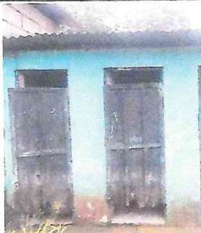
Foto 5: Puertas de los sanitarios dañadas, no cuentan con chapa para poder cerrarlas.